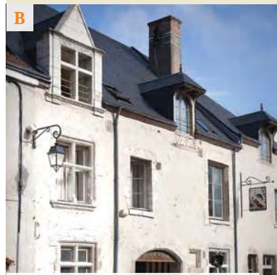
Ancienne auberge "la belle autruche"

L' ancienne maison de Louis XI (F) se trouve au n°2 du passage Chanoine Cachon, au plus près de la Basilique. Dévastée par les protestants en 1562 puis restaurée en 1651, elle abrite aujourd'hui une école. Au n°3 de la rue Louis XI, une imposante maison du 15 e siècle (G) a conservé son aspect d'origine avec son contrefort d'angle et les ouvertures étroites et disparates de la façade. Derrière les platanes qui bordent le grand mail , le mur recouvert de lierre est un vestige du mur d'enceinte (H) .