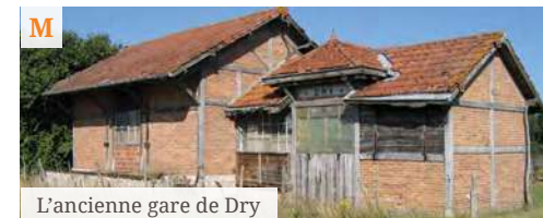
L'ancienne gare de Dry

"Borne-girouette" Saint-Jacques de Compostelle (I), réalisée par l'artiste orléanais Yann Hervis .