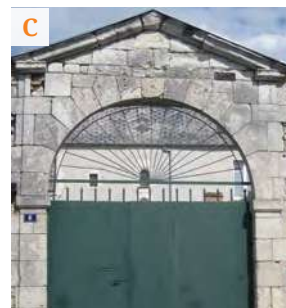
La maison dite de "l'hermitage"

Le portail (C), surmonté d'un fronton triangulaire, date du 17 e siècle. À l'arrière, on entrevoit la maison construite vers 1518 par Gilles de Pontbriand , doyen du chapitre de Notre-Dame et son frère François, conducteur des travaux de Chambord.