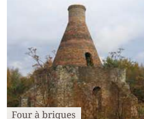
Four à briques