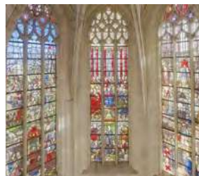
La Basilique Notre-Dame

Elle était protégée par quelques tours encore visibles. Identique à la tour située dans la cour de la mairie (E), celle de la place de Gaulle a conservé sa hauteur (J).