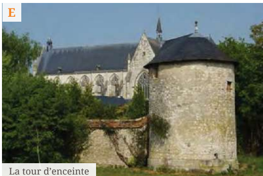
La tour d'enceinte

Enfin, avant de repartir, n'oubliez pas de déguster les vins A.O.C. Orléans-Cléry que vous trouverez chez les vignerons et les producteurs locaux.