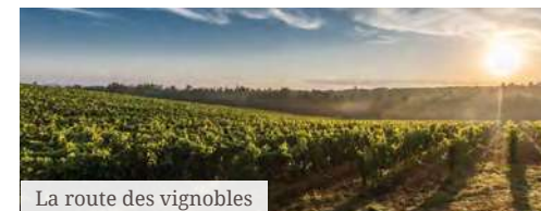
La route des vignobles

Déjà, durant l' Antiquité romaine , la vigne était largement présente dans la région. Une grappe de raisin figurant sur le blason de la commune de Cléry témoigne de cet attachement.