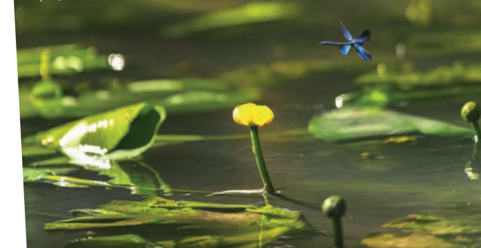
Caloptéryx au-dessus des nénuphars jaunes

10 Traversez la route et prenez la rue des Tanneries. Tournez à gauche rue des Remparts et passez devant « La Monnaie » puis à gauche rue du Pont Branlant. Continuez en face, Impasse du Fort puis prenez la première à gauche et rejoignez le point de départ.